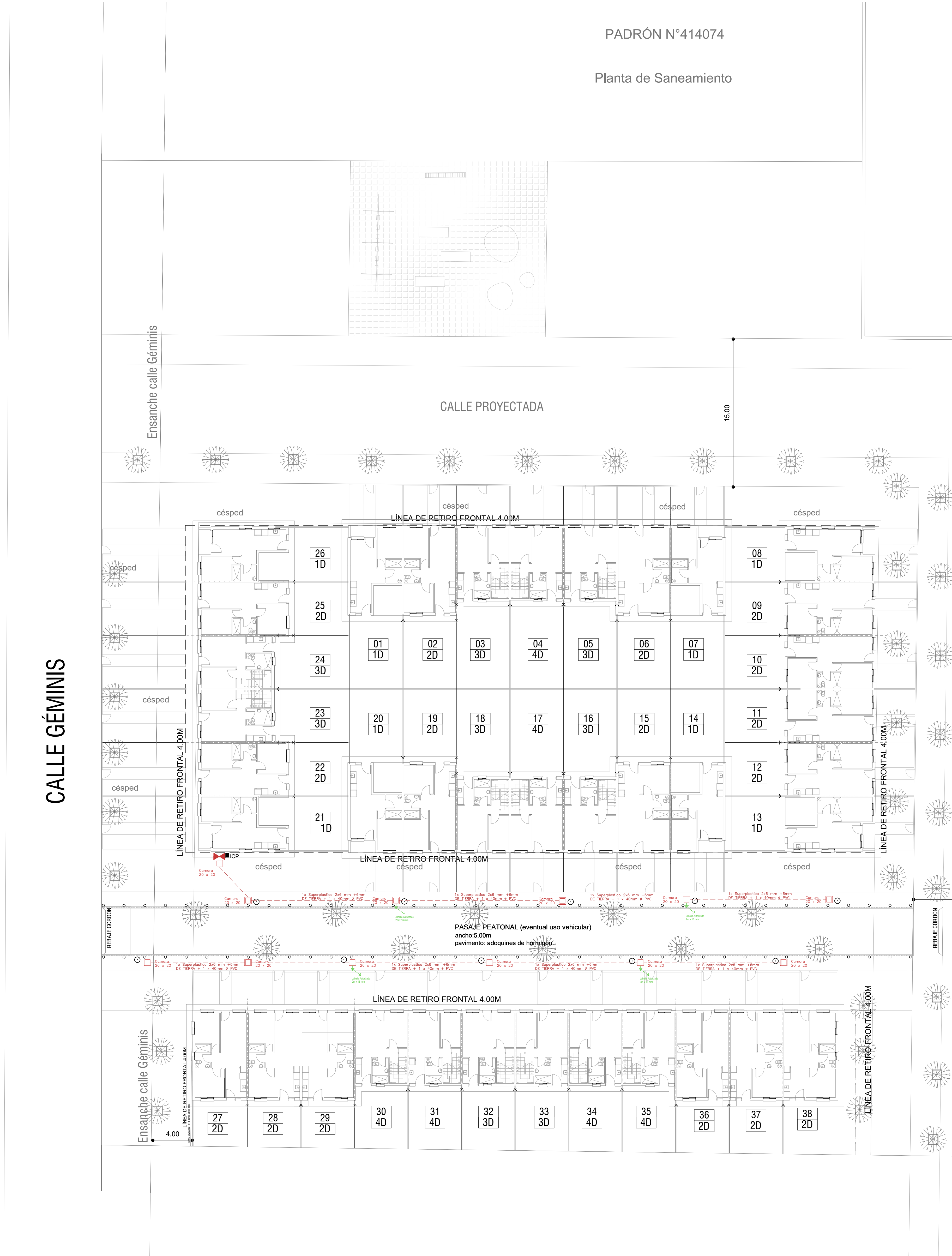
PLANTA BAJA - escala 1/200